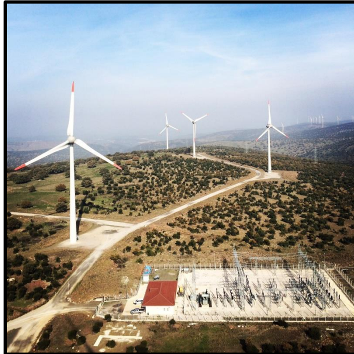
Şekil 1. Rüzgar Türbinleri ve Şalt Sahası Örneklerinin Fotoğrafları